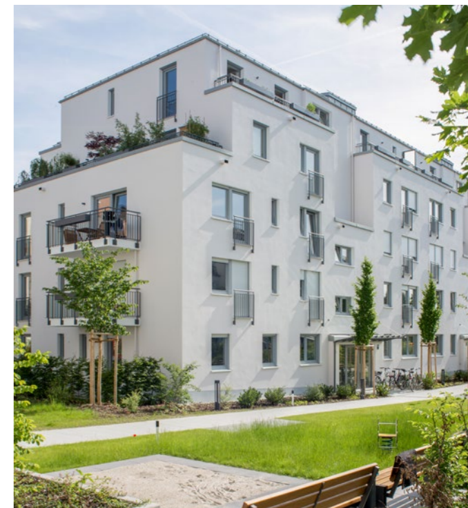
Wohnwerk II in München-Sendling

Ob kompakte Citywohnung für Singles, die erste gemeinsame Wohnung für junge Paare, ein großzügiges naturnahes Familienheim oder die barrierefreie Wohnung für Ältere, ob clevere Kapitalanlage oder moderne, flexible Gewerbefläche: Mit fachlichem Knowhow, visionärer Kraft und empathischem Gespür lassen wir Immobilien entstehen, die rundum überzeugen. Vom ersten architektonischen Eindruck über die handwerklich solide Bauausführung bis hin zum perfekten Innenausbau mit stilvollen Ausstattungsdetails.