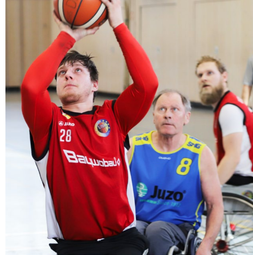
USC München Rollstuhlsport e.V.