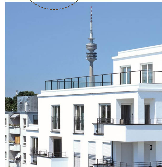
angerer in München-Schwabing