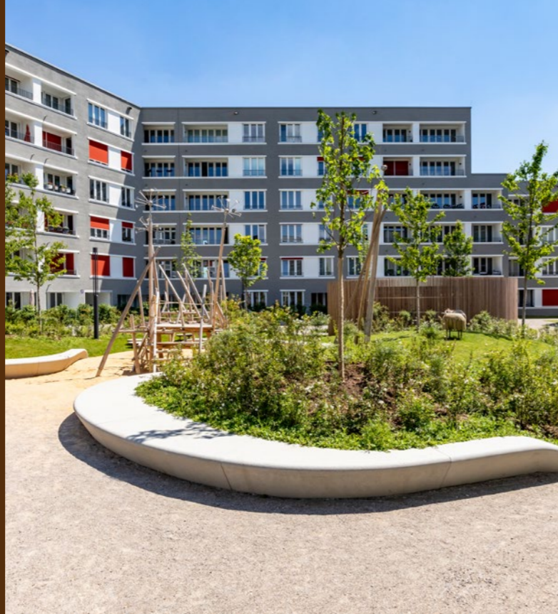
anders wohnen 1 in München-Pasing/Obermenzing