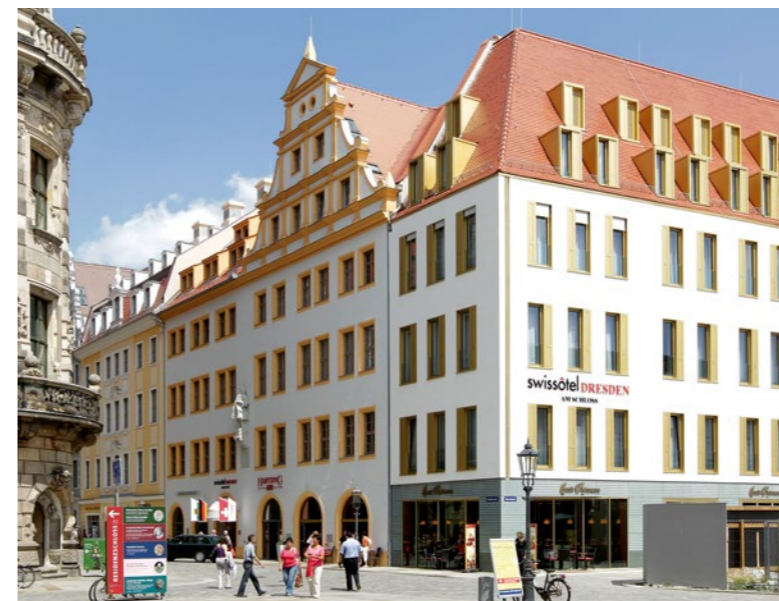
Schlosshotel in Dresden